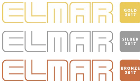
Neue ELMAR-Logos in den Kategorien 1 bis 3

Neben der neuen Kategorie „ELMAR Arbeitgeber“ sowie den veränderten Auszeichnungen mit „Gold“, „Silber“ und „Bronze“ und der Vergabe eines „ELMAR Newcomer 2017“ hat sich ebenfalls das Erscheinungsbild des ELMAR gewandelt. Eine feinere Linienstärke sorgt, in Kombination mit einer dezenten Optimierung des Schriftbilds, für eine reduzierte und stilvolle Gestaltung des neuen ELMAR-Logos.